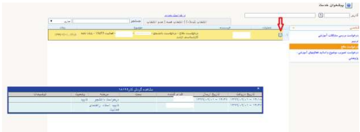
شکل شماره ۶