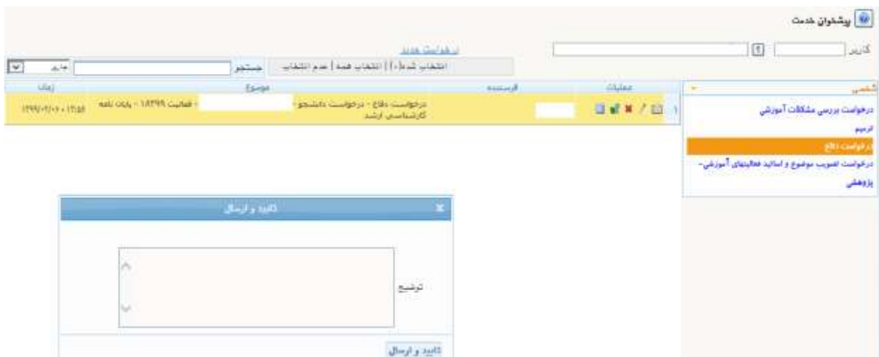
شکل شماره ۵

توجه ۱: در صورتی که به هر گونه توضیح در خصوص درخواست نیاز باشد ، دانشجو می تواند پیش از ارسال درخواست در قسمت توضیحات، یادداشتهای موردنیاز را تایپ نماید.(شکل ۵)