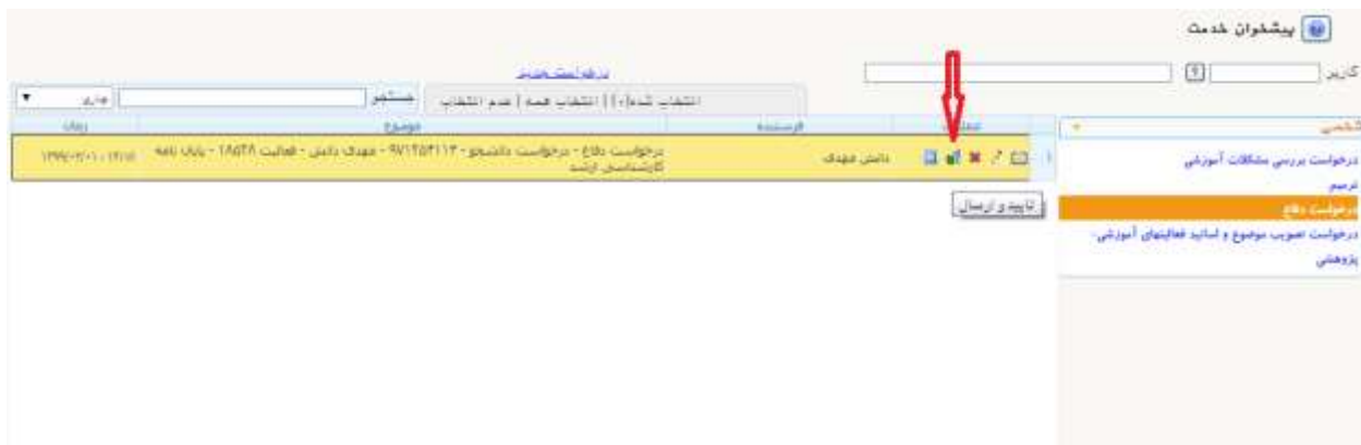
شکل شماره ۴

توجه ۱: در صورتی که به هر گونه توضیح در خصوص درخواست نیاز باشد ، دانشجو می تواند پیش از ارسال درخواست در قسمت توضیحات، یادداشتهای موردنیاز را تایپ نماید.(شکل ۵)